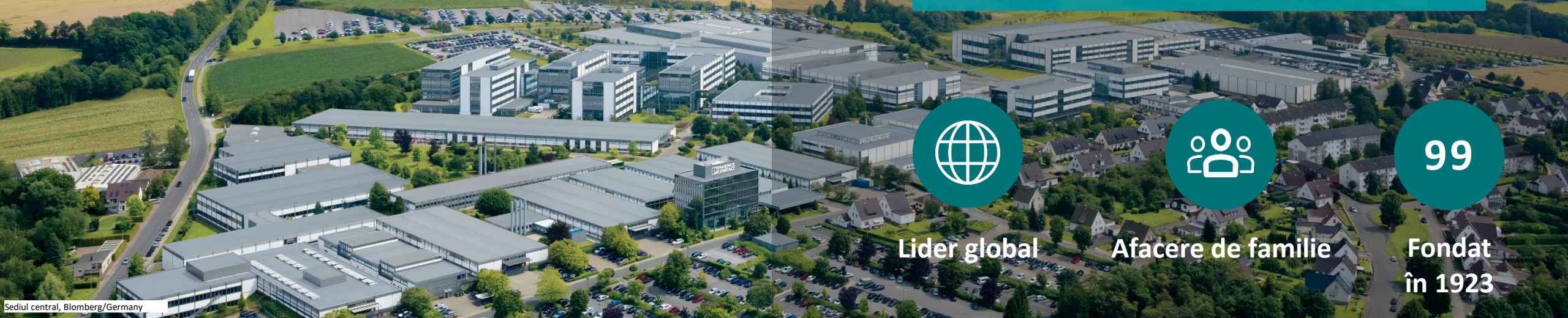
Sediul central, Blomberg/Germany

Phoenix Contact dezvoltă și produce echipamente și tehnologii pentru industria electrică și electronică destinate alimentării, protejării, conectării și automatizării sistemelor.