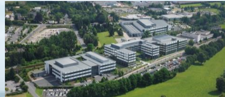
Centrul de inovație în electronică, Bad Pyrmont/Germany