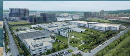
Centrul de competență, Nanjing/China