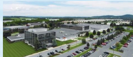
Centrul de competență, Harrisburg/USA