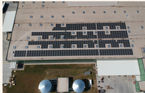
SMW | Fabrica de biciclete